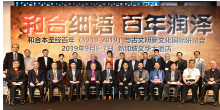
和合本百年纪念研讨会讲员合影

新 加坡四宗华文教会理事会（简称理事会）、三一神学院等于2019年主办了“和合细语，百年润泽——《和合本》圣经百年与古文明新文化国际研讨会”。来自新马印中四方的教会领袖和学者们聚集一堂，探讨了《和合本》圣经译本的历史意义和文化价值。2020年，疫情肆虐，但仍无法阻止研讨会文集的出炉。今年9月4日，理事会将进行文集发布会，与教会分享研讨会的成果。