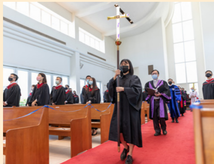
院长与讲师列队进入礼堂

经 过了一整年大流行的洗礼，第七十一届毕业生在一个历史性的微妙时刻完成了在三一的神学装备。在非常短的时间里，世界的新格局已经开始，人与人的关系的新格局却还在进行中，历史性的“现在进行式”进入不断地再定义的状态。毕业生该如何在这样的微妙时刻带着神赋予的起初的呼召以及毕业袍上所象征的“智慧囊”进入禾场，捍卫并持守教会在凡事都要“再定义”的历史时刻依然不变形，似乎是他们不可避免的真实。对当中的多数人而言，三年前进入三一的时刻是以“破碎”这个主题为起点开始在三一的神学生涯。如今回首，这个主题别有新意——被破碎的不止是神的器皿，而是整个人类世界的连接。这样的破碎，对马上就要进入禾场的神的仆人是一种什么样的托付，是每一位毕业生不可避免的真实，属于神的仆人的真实。