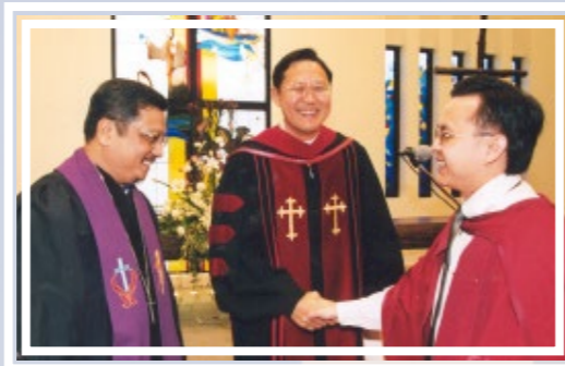
首个冠名教授席就任典礼 (2002年)