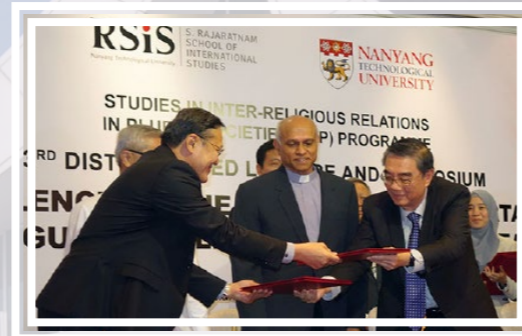
与新加坡南洋理工大学拉惹勒南国际关系研究院 签署谅解备忘录 (2017年)