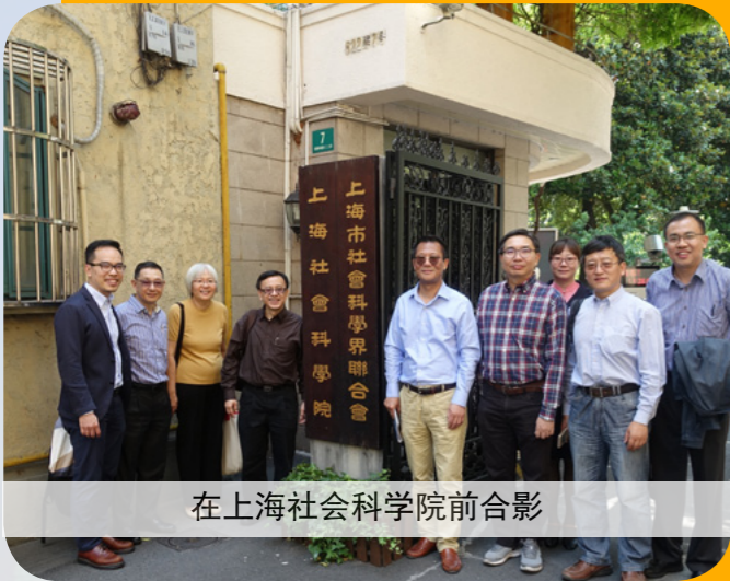
在上海社会科学院前合影

一教职员在今年5月20日至24日赴上海进行了退修之旅。经过了2018年筹办一系列学院70周年庆祝活动以及出版纪念特刊的紧张忙碌，讲师们都对这次的旅程翘首以盼。除了期待已久的休闲时光，退修之旅也让同事们可以在轻松的氛围中培养友谊，同时更深入认识中国与中国教会丰富的历史与文化。