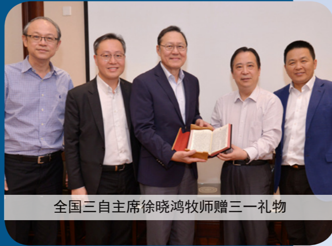
全国三自主席徐晓鸿牧师赠三一礼物

退修旅程的第二天，教职员分成三组进行访问。第一组由我们的院长魏丰年博士（牧师）率领，拜会了中国基督教协会（简称全国基协）和中国基督教三自爱国运动委员会（简称全国三自）的总部，得到了全国三自主席徐晓鸿牧师，以及全国基协副会长及总干事单渭祥牧师的接待。魏博士在开场致辞中，重申了三一与中国教会之间的深厚友谊，也谈到中国教会在全球基督教中所发挥的重要作用，并表示三一将继续致力于与两会（全国基协和全国三自）合作，培训他们的牧师。徐牧师回应了我们院长对双方之间友谊的肯定，并介绍了中国教会近期的发展。然后，单