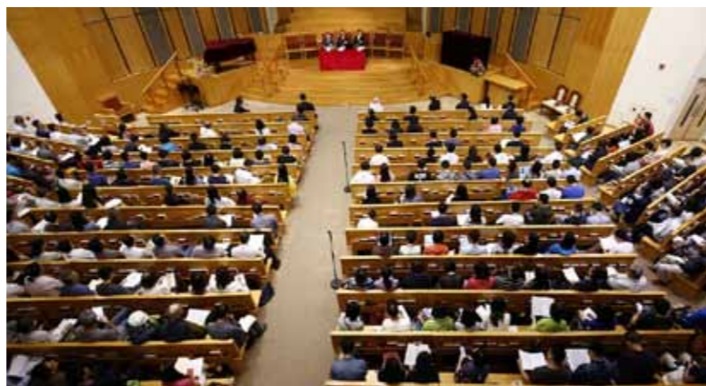
研讨会和讲座会场